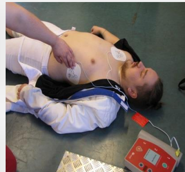
Kuva 2.5 Defibrillaattorielektrodien laitto.