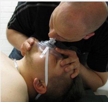
Kuva 2.4 Puhallusmaskin käyttö.