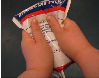
Kuva 8.1 Kylmäpussin aktivointi.