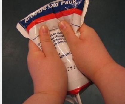
Kuva 6.5.2 Kylm pussin aktivointi.