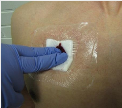
Kuva 6.2.3 Haavan painaminen sidoksen laittamisen jälkeen.