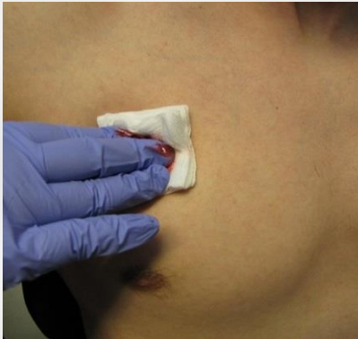
Kuva 6.2.1 Haavan painaminen taitoksella ja sormilla.