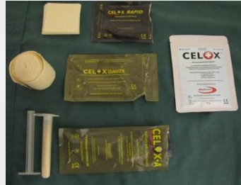
Kuva 5.2 Hemostaattisidoksia ja -jauhetta. Hemostaatti on verenvuodon tyrehdyttävä valmiste.