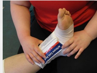
Kuva 8.4 Kylmäpussin asettaminen tukisidoksen päälle.