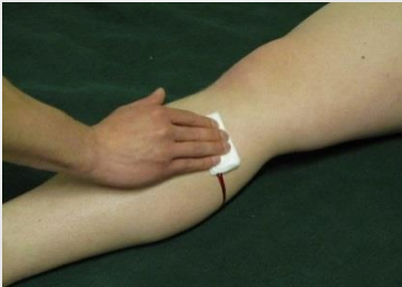
Kuva 5.1 Verenvuodon tyrehdytys painamalla.