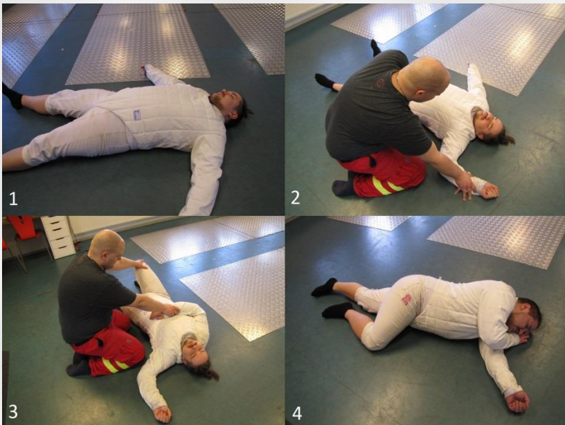
Kuva 3.2 Autettavann asettaminen kylkiasentoon.