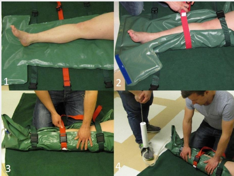
Kuva 12.3 Alaraajan tukeminen tyhjiölastalla.