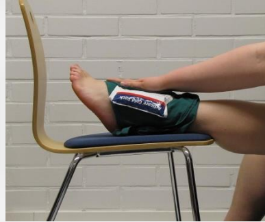
Kuva 8.2 Jalan kohoasento tuolilla ja kylmähoito.