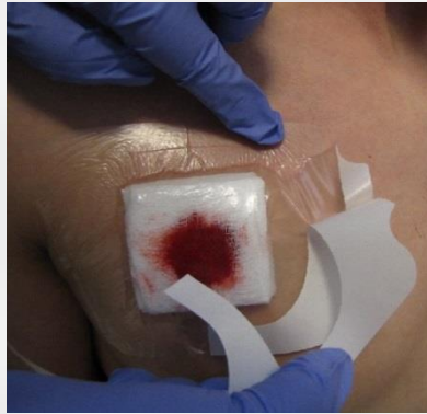
Kuva 6.2.2 Kalvon asettaminen haavan päälle.