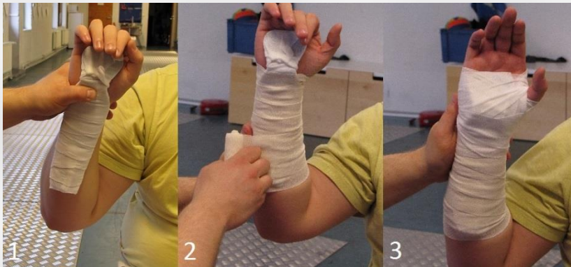
Kuva 12.1 Ranteen tuenta sideharsolla pehmustetulla lastalla ja sideharsorullalla, sidonta ylhäältä alaspäin.