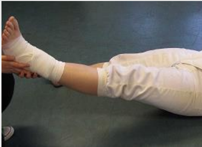
Kuva 8.3 Jalan kohoasento tukisidoksella.